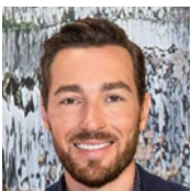
Sven Voss Moderator des aktuellen Sportstudios im ZDF