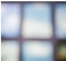
Gazelle Vollhase Transvorzeigequotenikonin und Comedy Queen