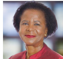
Dr. Mamphela Ramphele Co-Präsidentin des Club of Rome